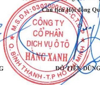
ĐỖ TIẾN DŨNG